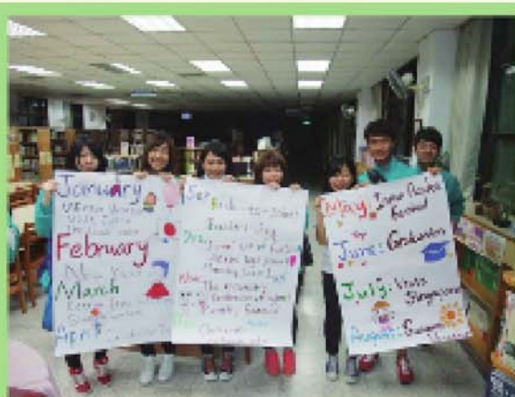
圖 5 國際交流跨海傳情活動