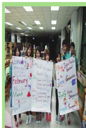
圖 5 國際交流跨海傳情活動