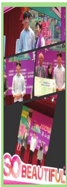
圖 2 學生獲頒草山基金會獎學金

(一) 普獲社區的認同：社區對學校提供的資源與贊助愈來愈多，學生受邀參與社區活動的機會也愈來愈多，可見學校學生學習的表現普獲社區認同。